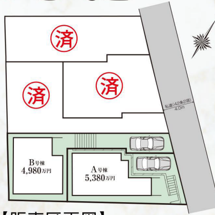
【販売区画図】 ※実測図ではありません

【A号棟】 販売価格 5,380 (税込) 万円 土地面積 / 98.20㎡ (29.70坪) SB: 1.51㎡ 建物面積 / 96.16㎡ (29.08坪) 間取り / 3LDK ※第AI建築確認00-2300145号